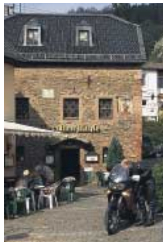
Im alten Ortskern von Heimbach (o.). Nürburgring-Grand-Prix-Strecke (ganz o.).

Den Einstieg in unser Motorrad-Eldorado haben wir über die A1, Ausfahrt Euskirchen/Wißkirchen gefunden. Die Fahrt geht vorbei am Verlagssitz unserer Zeitschrift »Tourenfahrer«, der Burg Veynau. Gleich um die Ecke liegt trutzig der nächste mittelalterliche Herrnsitz, die Burg Satzvey – bekannt durch ihre alljährlichen Ritterspiele und mittelalterlichen Jahrmärkte.