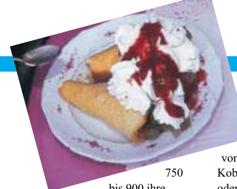
750 bis 900 ihre

Geschichte: Von 50 bis etwa 400 nach Christi war die Eifel ein Grenzgebiet des römischen Reiches. Im Provinz-Zentrum Trier kreuzten sich große Militär-Fernstraßen. Die römische Blütezeit der Eifel wurde im fünften Jahrhundert durch einfallende Franken beendet. Die Karolinger bereiteten der Eifel von